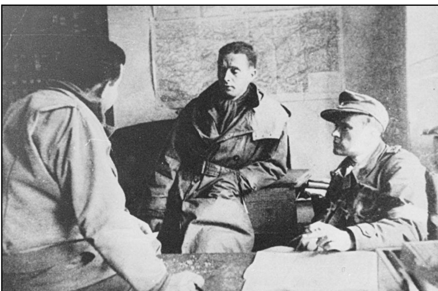
Lagebesprechung im Gendarmerieposten Zirl (Tirol), 30. April 1945