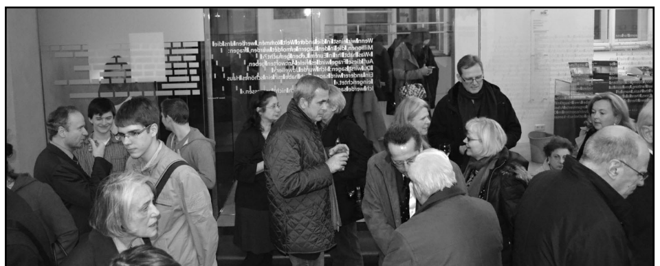
Unten: Ausklang der Jahresversammlung in der Ausstellung des DÖW