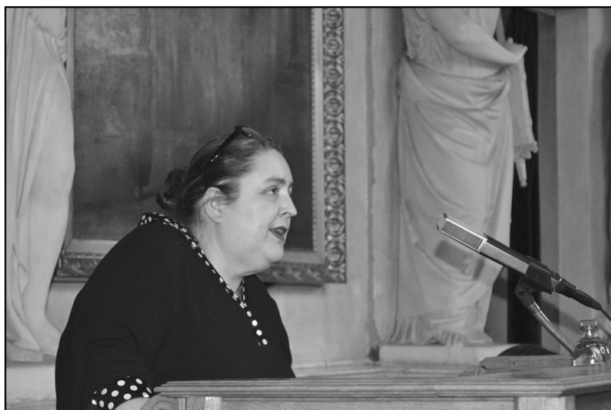
Jahresversammlung des DÖW, Altes Rathaus, 14. März 2012