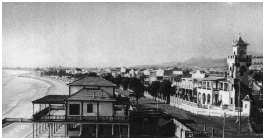
Zeitgenössische Ansicht von Benicàssim.