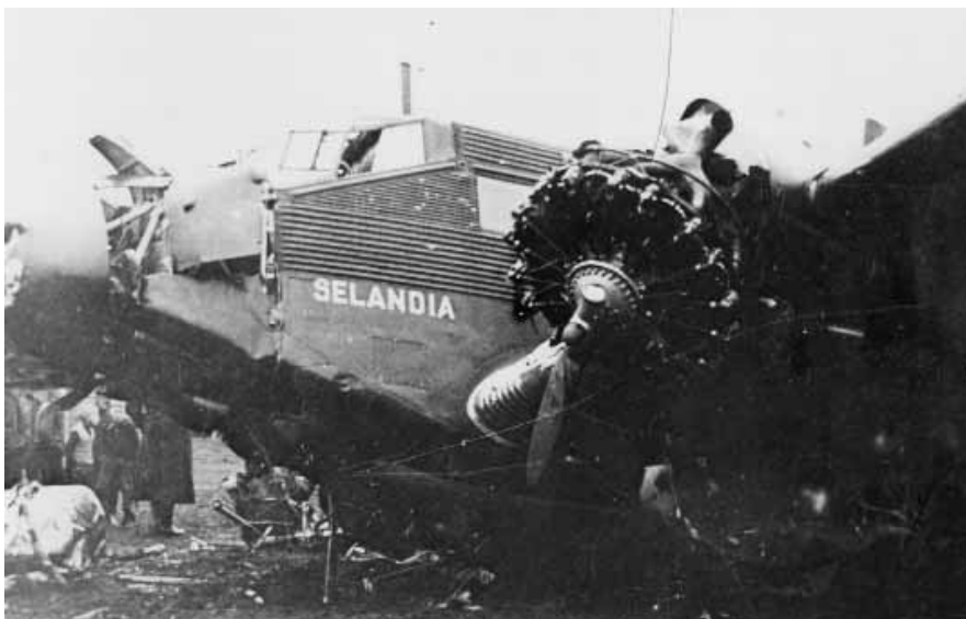
Das Flugzeug vom Typ JU 52, in dem sechs Schutzbündler nach Spanien unterwegs waren, nach der Notlandung in Hamburg-Fuhlsbüttel.