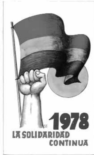
Neujahrskarten der österreichischen Vereinigung, gestaltet von Bruno Furch.

Die Zahl der noch lebenden Spanienkämpfer nimmt ab. Schon sind wir an den Fingern einer Hand abzuzählen. Deshalb auch hat es mich gedrängt, das Lexikon fertigzustellen. Es ist durchaus für eine kleine Ewigkeit gedacht, als Hinterlassenschaft zu Lebzeiten und als einigermaßen stabiles Fundament für jedes spätere Werk über österreichische Freiwillige auf Seiten der Spanischen Republik. Auf dessen Urheber wartet leichtere und schwerere Arbeit zugleich: Sie werden nur noch Gestalter, nicht mehr Mitwirkende unserer Geschichte sein.