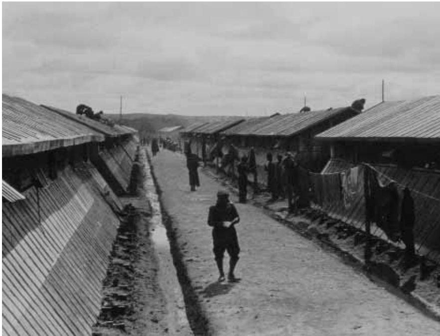
Das Lager Gurs bestand aus dreizehn mit Stacheldraht umzäunten Sektoren (Ilots), die mit den Buchstaben A bis M gekennzeichnet waren. Ilot I war für die deutschen und kubanischen Spanienkämpfer bestimmt – die Österreicher wurden von der französischen Lagerleitung nicht mehr als nationale Gruppe angesehen, sondern den Deutschen hinzugerechnet.

che Zahl wie im Februar vierunddreißig, beim Marsch der Floridsdorfer Schutzbündler zur tschechischen Grenze.« Aber am 8. Februar 1939 mußte auch diese Stellung geräumt werden. Die letzten österreichischen Freiwilligen reihten sich in Vilajuïga in den Flüchtlingsstrom ein. Tags darauf erreichten sie die Grenze.